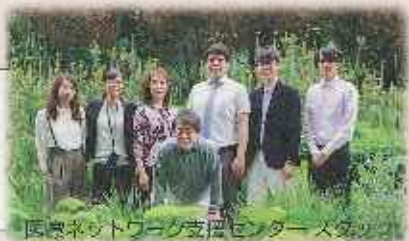
医療ネットワーク支援センター スタッフ