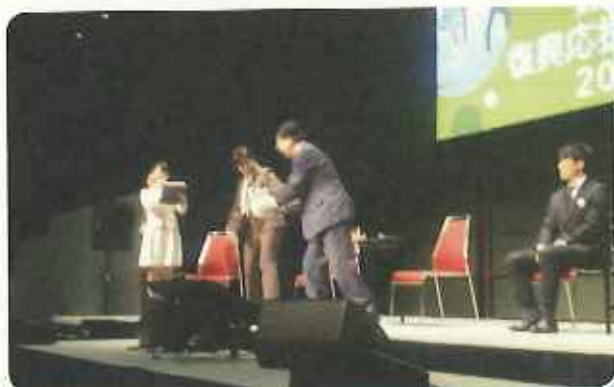
メッセージボール贈呈の様子

その後、小池知事は、岩手県釜石市でラグビーワールドカップ2019が開催された達増岩手県知事からメッセージラグビーボールを贈呈され、東北からの思いを受け取りました。