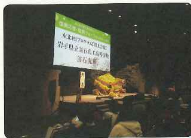
伝統芸能「釜石虎舞」

ワークショップなどが行われるとともに、東北4県及び東京都の復興への取組を紹介したパネル展示も行われ、たくさんの皆様に東北被災地の魅力を感じていただけるイベントとなりました。