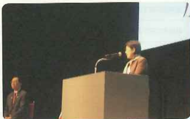
小池都知事の挨拶

ステージイベントでは、小池都知事が東京2020オリンピック・パラリンピック競技大会に触れ、「被災地の復興なくして大会の成功はない。被災地のニーズをしっかりと伺