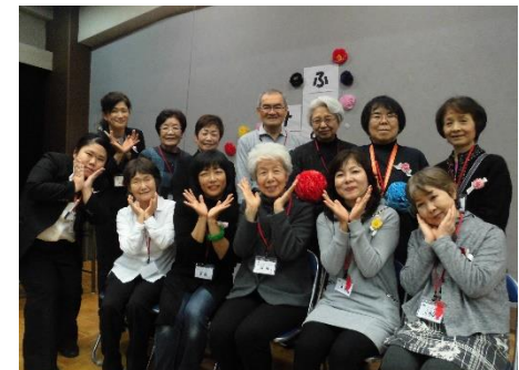
交流会世話人の皆さん