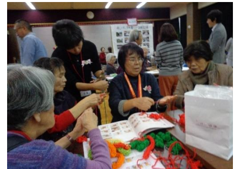
ふれあいサロン体験の様子

今年の春から企画を練りに練っていた、西新井地域ふれあいサロン交流会世話人の皆さんは「高齢者が第 2、第 3 の人生に飛び立つことができるよう、さらに ふれあいサロン同士の連携を深めていきたい 」と話されていました。