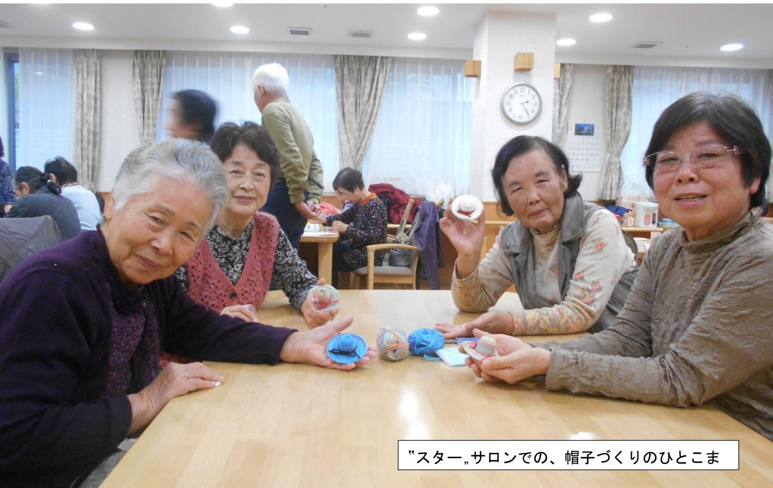
“スター”サロンでの、帽子づくりのひとつま