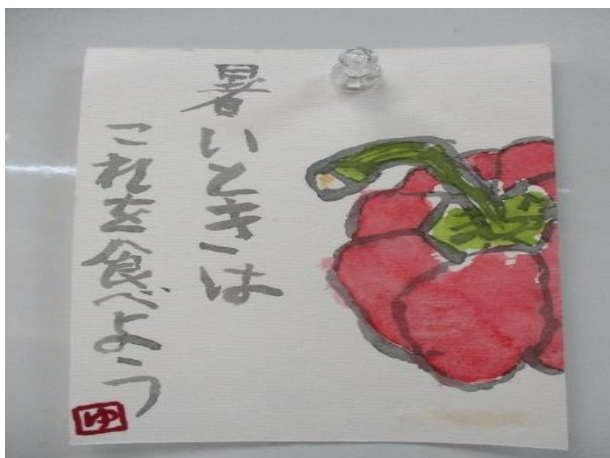
ボランティア体験した中学生の作品。 お祖父さんに送るそうです！