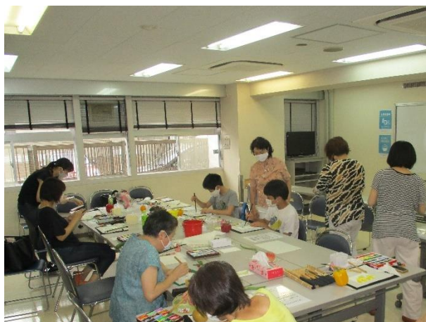
緊急事態宣言が明けて始めてグループメンバー全員が集まりました。 活動ができる楽しさを改めて感じたそうです。

取材日 : 令和2年8月14日 参加したボランティア数 : 2名 取材メモ : with コロナ時代。感染対策をしっかりしたうえでボランティア活動する方が増えるといいなと思います！ (川畑) 問合せ先 : 足立区総合ボランティアセンター ☎3870-0061 FAX3870-5900