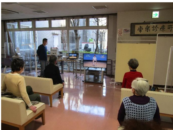
最後は座って、無理なく背伸びをしたり、しゃがんだり、無理なく体操します。