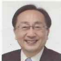
青森県知事 三村申吾