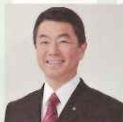
宮城県知事 村井嘉浩