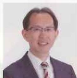
福島県知事 内堀雅雄