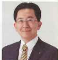
岩手県知事 達増拓也