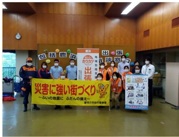
今回、共催した皆さんで記念撮影。次の連携に向けて、すぐ意見交換がされていました。今後の取り組みが楽しみです♪