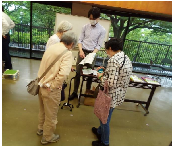
福祉用具展示ブースでは、介護ベッドや車いす・杖などの体験や相談などが行われました。スタッフが杖の使い方を丁寧に説明していました。