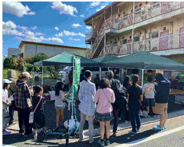
整理券の配布は11時。毎回配布開始前から長蛇の列だそうです。この日は、関三商店街の駄菓子屋irodoriの駄菓子販売とのコラボもありました。

主に毎月第3土曜日、中学生までは無料、大人は300円。この日のメニューはピーマンの肉詰め、五目ごはんなどで、117食提供しました。子ども食堂ですが、地域の誰でも受け入れてくれる食堂となっています。