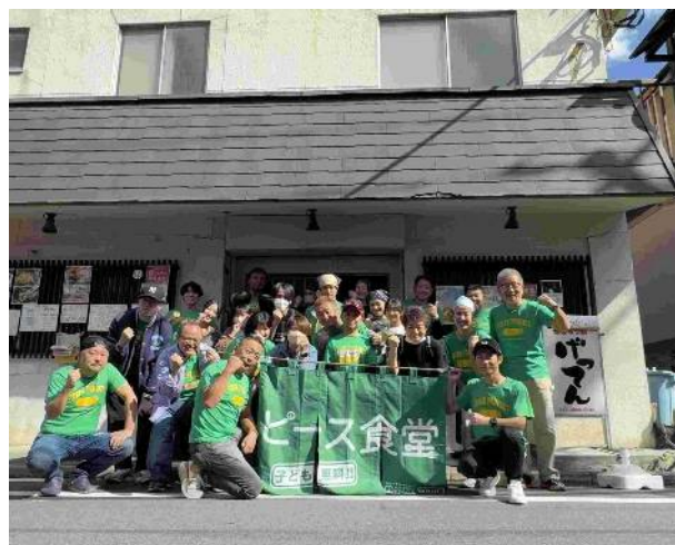
この日従事したボランティア26名全員で記念写真。区内だけではなく、都内のいろんなところからSNSを通じてボランティア応募があるそうです。