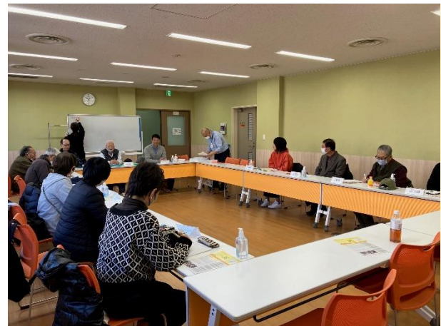
12月の振り返り会の様子。反省点や来年度に向けた思いを共有しました。この先、繋がりを広げて小学校等でのイベント開催を目指していきます。