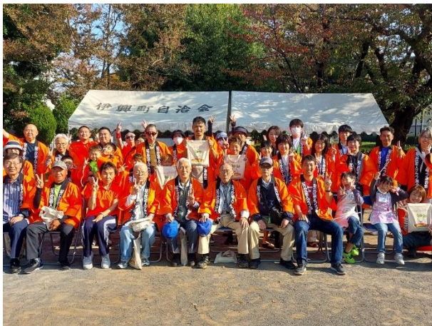
イベント終了後、実行委員の集合写真。爽やかな笑顔です。当日は子どもたちがボランティアとして各ブースにお手伝いに来てくれました。