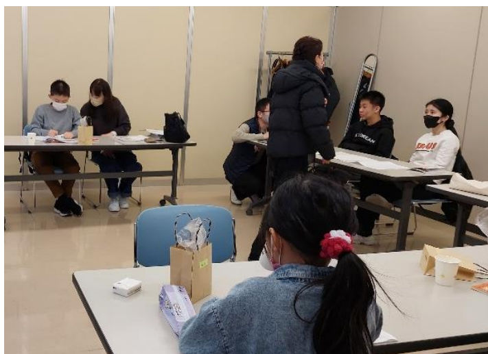
実際の活動の様子です。