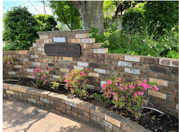
草むしりを経て、少しすっきりした花壇。施設の入り口にあるため、地域の皆さんも通る場所です。ここからどう変わっていくのでしょうか。