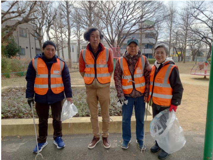
▲井堀北の風の皆さん。オレンジ色のビブスがトレードマーク