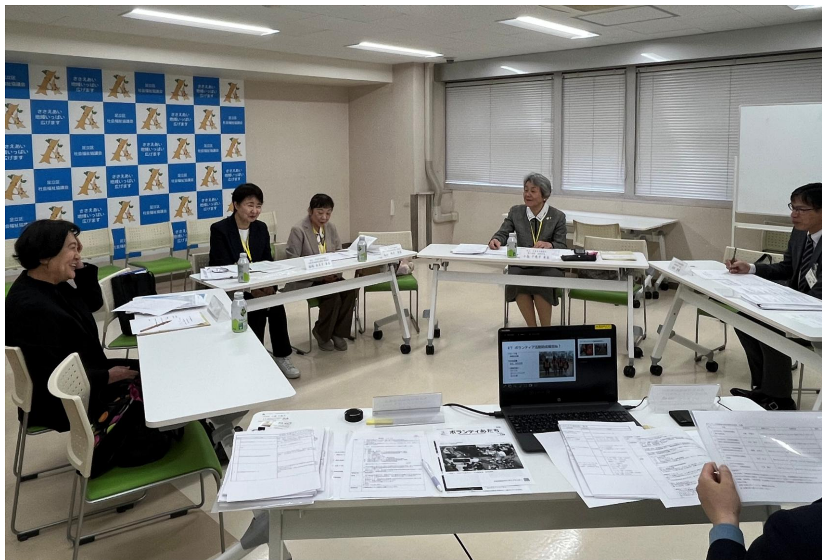
<写真> 令和8年度グループ活動資金 助成審査会のようす