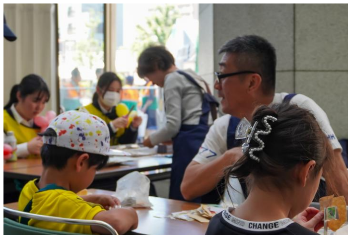
切手整理ボランティアを体験できるブース。使用済み切手を所定の形にはさみで切って整えます。小さなお子さんも参加していました。