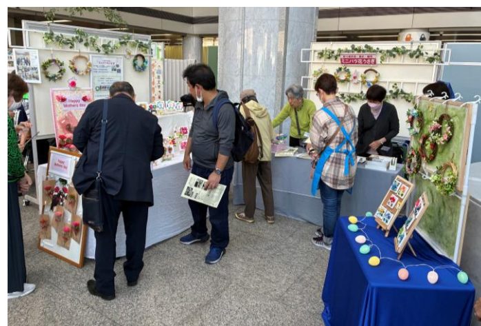
ボランティアグループが作成した作品を展示、販売していました。当日は母の日だったので、手作りカーネーションが大人気でした。