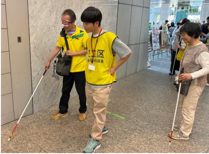
白杖体験ブースに従事している様子。体験者に付き添って、移動をサポートしていました。

東京電機大学、都立足立高等学校、都立淵江高等学校、都立赤羽北桜高等学校の学生ボランティア42名が参加し、出展ブースのサポート、バルーンアートブースの運営に従事しました。会場内には学生たちの元気な声が響き、活気あるボランティアまつりとなりました。