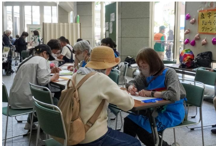
点訳体験ブース。ボランティアの指導のもと、点字キットを使用して、点字を打つ体験ができました。