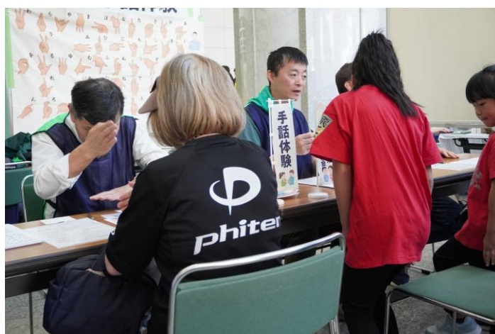
手話体験ブース。指文字やあいさつの手話を学べました。写真は、お疲れ様でしたの手話を行っている様子です。