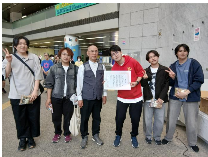
学生ボランティアに感謝状を贈呈

今回のボランティアまつりでは、学生ボランティア42名のほか、バルーンアートコーナーのサポートとして、4名の演芸ボランティア、会場内をきれいに保つために3名の清掃ボランティア、ボランティアまつりの様子を撮影する1名の広報ボランティアにご協力いただきました。また、株式会社マルハンからお菓子のご寄付いただき、学生ボランティアにプレゼントしました。皆様、ご協力ありがとうございました。