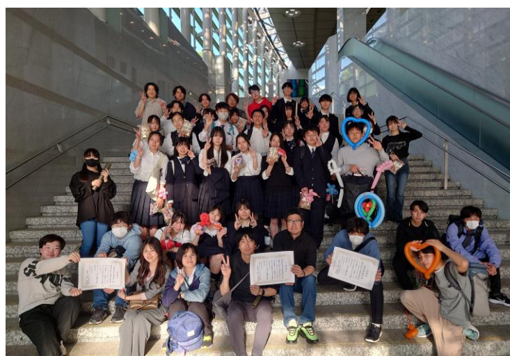
学生ボランティアの集合写真