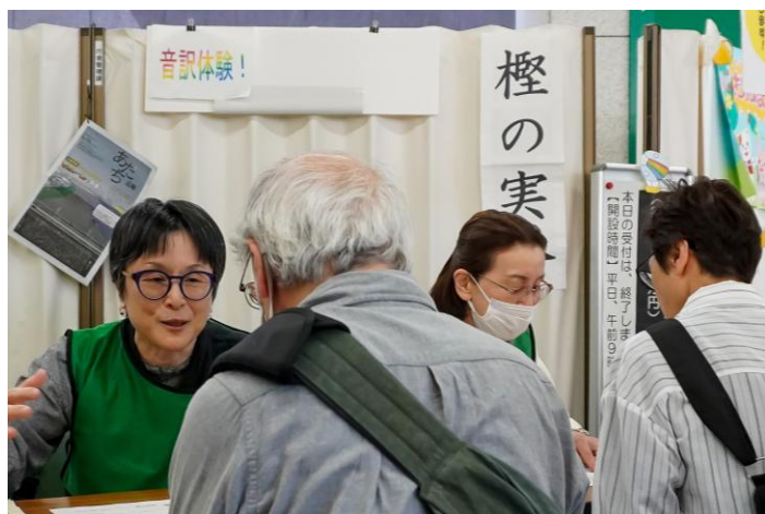
音訳体験ブース。正確に音声化する読み方のルールなどを教わり、自身の声を録音し聞くことができました。