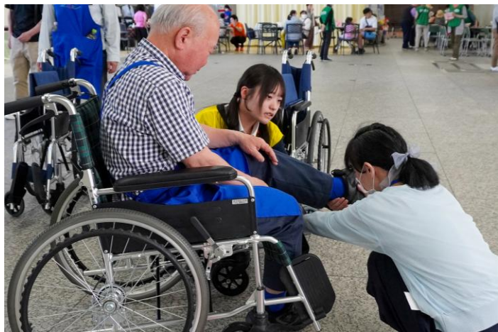
車いす体験ブース。学生ボランティアもサポートとして大活躍でした。

音訳・点訳などの体験型コーナー、自主製品を販売する物販ブースなど、多種多様なブースがあり、多くの来場者でにぎわっていました。各ブースを巡り、ボランティア活動に興味・関心を持ち、ボランティア活動を始めのきっかけにつながる場になっていました。