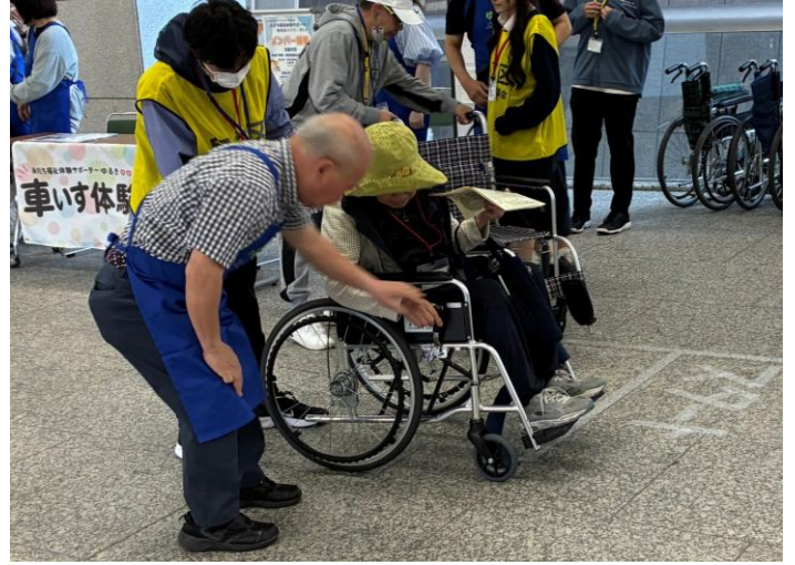
車いす体験ブースに従事している様子。車いすの操作方法をレクチャーしていました。